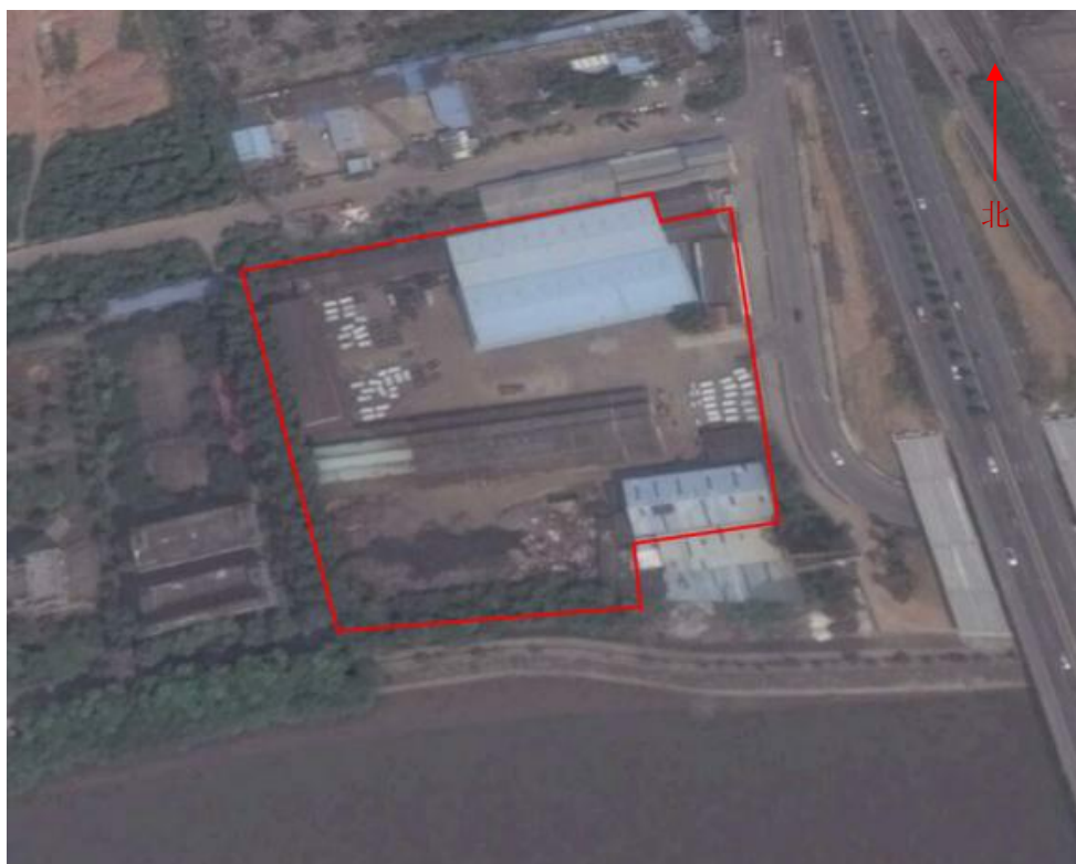
图 1 项目现场卫星图

2.1 项目场地位于佛山市南海区桂和公路旁, 占地面积约 1 万平方米, 1986 年 10 月开始建厂从事热镀锌, 属于电镀行业, 主要经营热镀锌铁塔加工、供电器材镀锌和微波塔五金杂件镀锌等。该厂于 2012 年 5 月关闭停产, 2015 年佛山市绿润环境管理有限公司租用该地块, 作为垃圾运输工具停放地, 部分区域还堆放有垃圾。场地规划用地为商住用地。